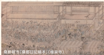
桑都朝市「桑都日記稿本」(極楽寺)

また、八王子の景勝地を詠んだ「八王子八景」のひとつ「桑都の晴嵐 セイラン 」からも、桑都にふさわしい桑畑の景色が広がっていたことが分かります。